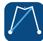
Radio de giro ▼