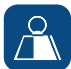
Peso total producto ▼