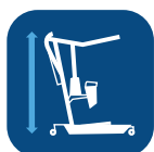
Máx. Altura (con brazo corto/extendido) ▼