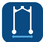
Anchura de la base ▼