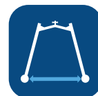
Ancho interno con patas abiertas ▼