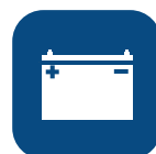
Ciclos (elevaciones por carga)** ▼