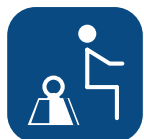
Peso seguro SWL ▼

Todas las medidas se han realizado con ruedas de 100mm, placa de bipedestación inclinada 5° y un usuario de 80kg. Todas las medidas han sido tomadas con una tolerancia de + 3%.