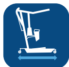
Longitud de la base ▼