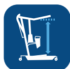
Rango de elevación (con brazo corto/extendido) ▼