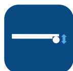
Altura de pata ▼